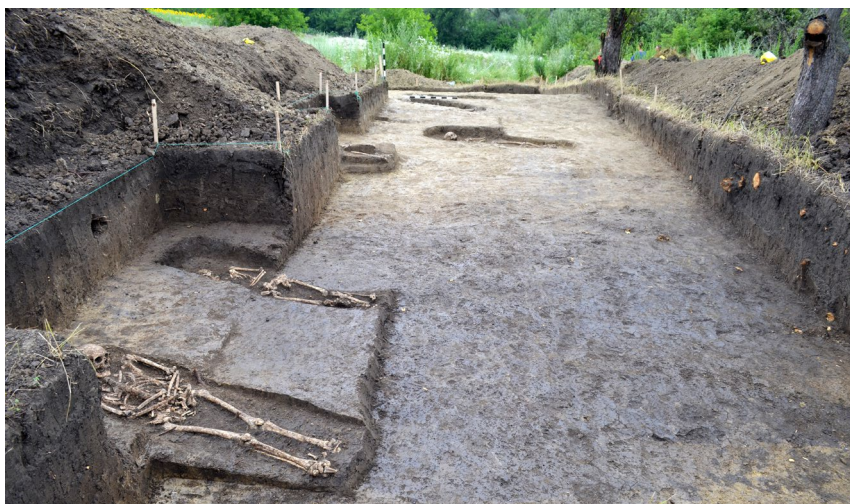
Figura 1. Lozova 2014. Vedere dinspre est asupra necropolei medievale după curățarea mormintelor

anului 2014 au fost continuate săpăturile arheologice, este amplasat în imediata apropiere a hotarului dintre satele actuale Lozova și Vorniceni din valea Bucovățului.