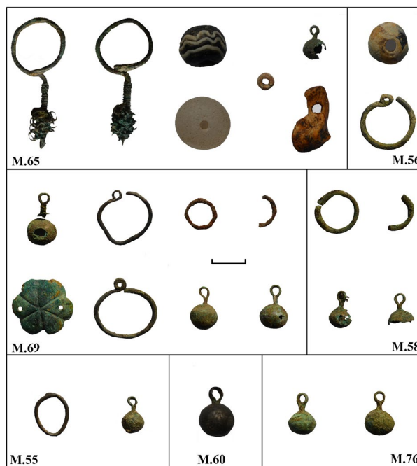
Figura 4. Lozova 2014. Piese de inventar descoperite în necropola medievală

Pe linie demografică, cercetările antropologice au remarcat „un caracter inedit al acestui complex medieval”, întrucât în timpul campaniei de săpături efectuate în anul 2014 au fost descoperite două cazuri (mormintele 73 și 77), în care craniile prezintă urme de trepanație, ambele schelete aparținând unor indivizi de sex masculin, cu vârstele la deces trecute de 50 de ani. Potrivit cercetătorilor antropologi, „craniul scheletului deshumat din mormântul 73 prezintă două trepanații localizate pe osul frontal, în apropierea suturii coronare, deschiderile fiind mai mult sau mai puțin circulare, dispuse aproape simetric față de linia de simetrie bilaterală”, subliniind faptul că