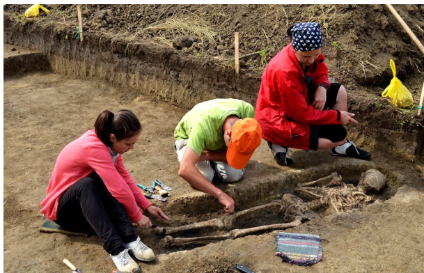
Figura 3. Lozova 2014. Cercetarea necropolei, moment de lucru

În ambele cazuri, cercetările întreprinse atât în perimetrul cimitirului medieval de la Sadova- Seliștea lui Tihomir , cât și în cel de la Lozova- La hotar cu Vornicenii au oferit deocamdată destul de puține elemente edificatoare pentru stabilirea cronologiei acestor necropole. Prezența unor monede în umplutura gropilor mortuare ar fi facilitat într-o anumită măsură stabilirea perioadei în care au funcționat acestea, chiar dacă suntem conștienți de faptul că nu în toate cazurile descoperirile monetare din situri pot constitui jaloane sigure pentru cronologia absolută a acestora. Corespondențe destul de apropiate pentru o serie de piese de inventar, descoperite în situl de la Lozova- La hotar cu Vornicenii , se găsesc